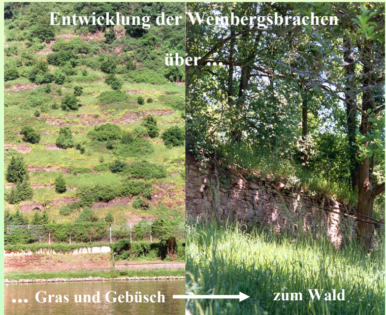
Entwicklung der Weinbergsterrassen