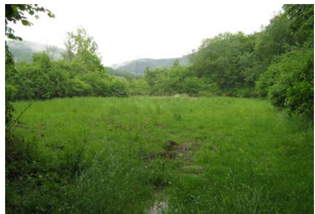
Gelände „Auf der Plätsch“