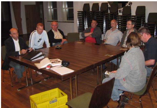
Mitglieder des Arbeitskreises

Zu Beginn begrüßte Herr Ortsbürgermeister Zenz die Anwesenden. Im Anschluss erfolgte durch den Unterzeichner ein Rückblick zum 1. Treffen des Arbeitskreises. Anschließend wurden die Eigentumsverhältnisse zum Planungsgebiet „Auf der Plätsch“ dargestellt. Nach Rücksprache mit der Verbandsgemeinde Untermosel befinden sich die grundlegenden Grundstücke im Eigentum der Ortsgemeinde Löf. Lediglich die Parzellen 450, 453 und 673 befinden sich in Privateigentum. Herr Ortsbürgermeister Zenz will im weiteren Verlauf die betreffenden Eigentümer kontaktieren (bei Bedarf der Fläche).